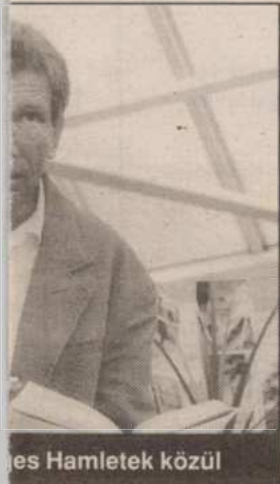
es Hamletek közül