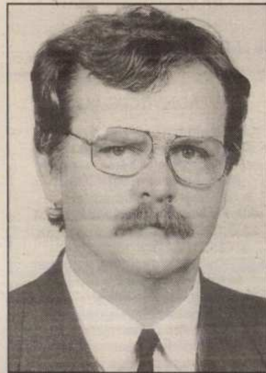
Zacsek: „Megnézik minden egyes dollárjuk helyét.”

Zacsek azt írja, hogy parlamenti interpellációja után „hirtelen Soros Györgyöt dicsőítő cikkek jelentek meg. A stílus a régi, a pártállami.”