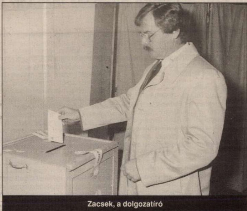
Zacsék, a dolgozatíró